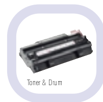
Toner &amp; Drum