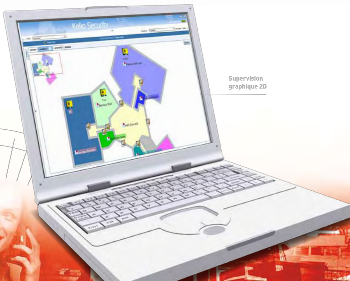
Supervision graphique 2D

Gestion jusqu'à 5000 personnes avec la possibilité de personnaliser tous les droits et autorisations.